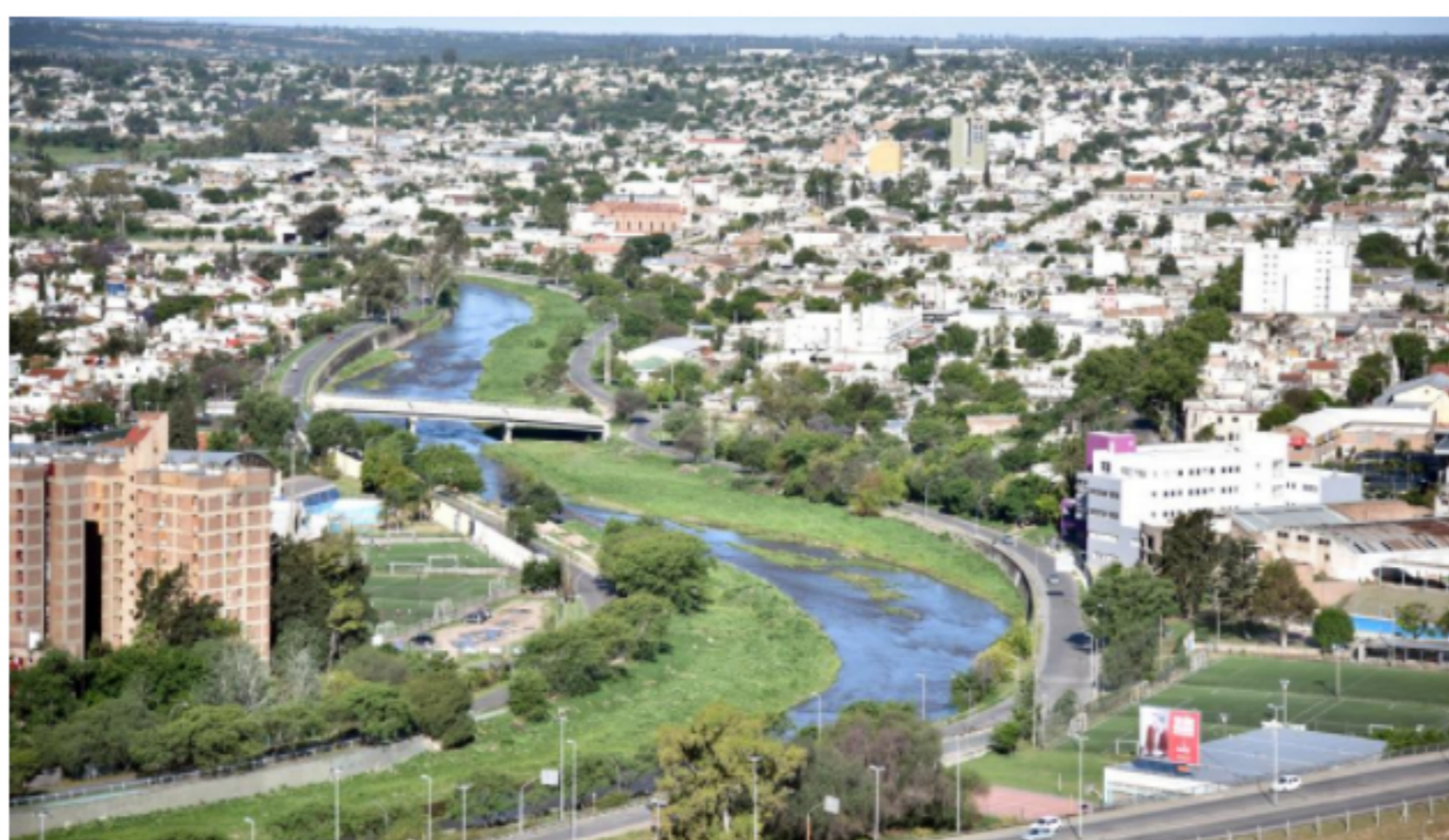
La Municipalidad de Córdoba estudia cambios para terminar con la expansión urbana. (Facundo Luque)

"Si expulsás población y la dispersás, nunca vas a lograr una ciudad eficiente, que es lo que necesita la ciudad de los 15 minutos. La expansión fue por monouso, residencial. Eso implica buscar servicios y equipamientos a otros lados", señaló.