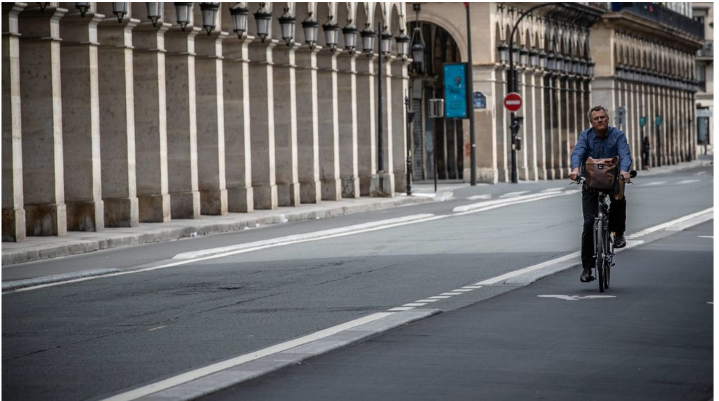
Un hombre pasea en bicicleta en Rue de Rivoli, Paris