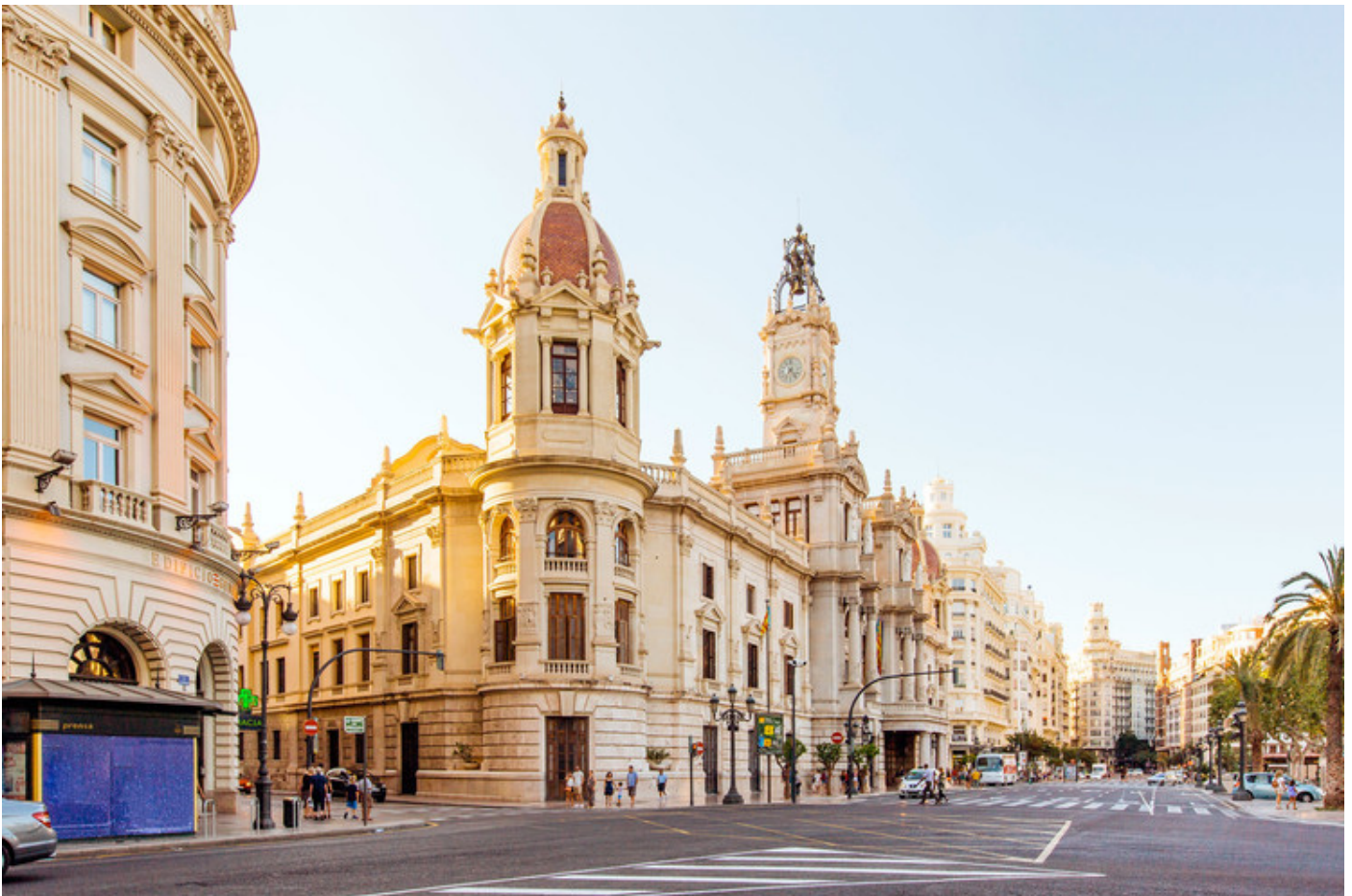
Valencia: una apuesta por el turismo sostenible

De esta forma disminuirían muchos desplazamientos, lo cual sería beneficioso para el medio ambiente.