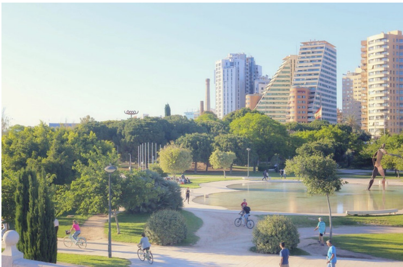
Valencia: ciudad de 15 minutos

¿Cómo? Apostando por la trazabilidad y poniendo en valor sus espacios urbanos y naturales, en equilibrio con el entorno y los ciudadanos. Así, Valencia aboga por la filosofía de “ciudad de 15 minutos”.