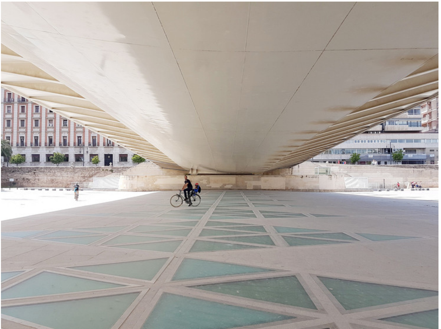
Valencia cuenta con cerca de 160 kilómetros de carriles bici y 40 ciclocalles

El plan incluye programas y medidas para fomentar el consumo de proximidad y la economía circular . Asimismo, contempla iniciativas de aprovechamiento del entorno para desarrollar proyectos que absorban más emisiones de CO2 .