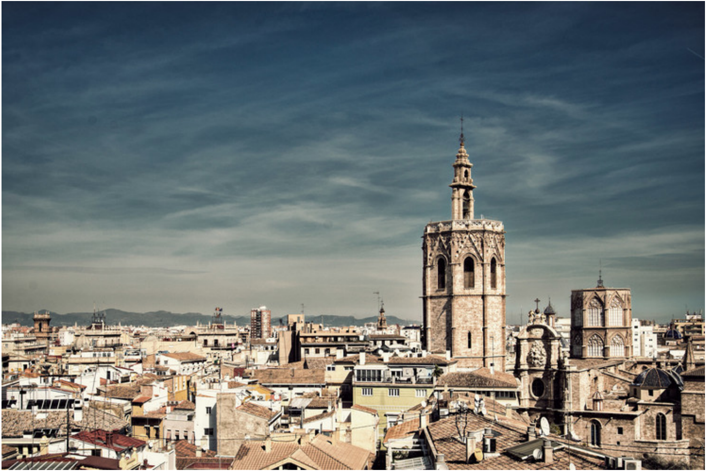
Valencia, la mejor ciudad del mundo para vivir en 2020 según los expatriados